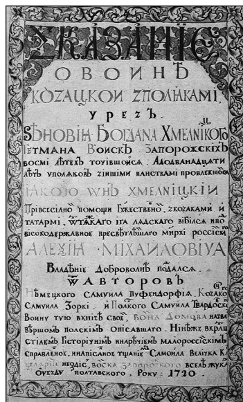
Самійло Величко. «Сказаніє о войнѣ козацкой з поляками...». 1720. Титульний аркуш.

Літопис В. спирається на широкую джерельну базу — праці А. Гваньїні , М. Кромера , С. Окольського , С. Пуффендорфа , С. Твардовського , козац. хроніки, документи Генеральної військової канцелярії , мемуари та ін. В. тяжів до змалювання істор. діянь і повчальних подій минулого «високим» стилем за правилами риторичного мист-ва. В дусі такої методології та естетики він вдавався до літ.