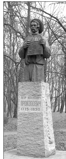
Пам'ятник П.І. Прокоповичу у м. Батурін. 1975. Фото 2009.

скінчивши курсу теології, вирушив 1694 або 1696 в освітню мандрівку. Був у Володимирі (нині м. Володимир-Волинський ) та Львові , де прийняв унію (див. Берестейська церковна унія 1596 ). Вчився в Кракові , Римі (Італія; 3 роки навчання в грец. колегії св. Атанасія), збагачував свої знання у Ватиканській б-ці . Пізніше таємно залишив Рим і далі подорожував Європою, насамперед Німеччиною ( Лейпциг , Галле , Єна ), де познайомився з ученими із протестантського табору, з якими підтримував зв'язки й пізніше. 1702 прибув до Почаївського монастиря (нині Почаївська Свято-Успенська лавра ), в якому повернувся до православ'я . 1704 прибув до Києва і прийняв чернечий постриг. Невдовзі став професором Київської академії , 1705—16 викладав поетику, риторику, фізику, математику, історію, філософію, теологію, 1711—16 — ректор. Перший почав знайомити студентів з ученнями Р. Декарта , Дж. Локка , Ф. Бекона , давав пояснення системи М. Коперніка та вчення Г. Галілея . Глибоко вірував у Бога, однак вважав, що матеріальний світ розвивається на основі власних закономірностей. Використовував мікроскоп, телескоп, звертався до експерименту, ґрунтовно цікавився математикою. 1716 рос. цар Петро I викликав П. до Санкт-Петербурґа , де той став проповідником, а з 7 квітня 1718 — єпископом Псковським , Нарвським та Ізборським і дорадником царя у держ. і духовних