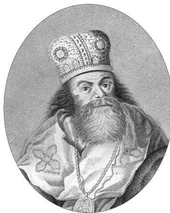
Феофан Прокопович. Гравюра 19 ст.

ПРОКОПОВИЧ Теофан (Феофан, світське ім'я — Єлизар або Єлисей; 17(07).06.1677—19(08).09.1736) — церк. і культ. діяч, просвітник, основоположник теорії освіченого абсолютизму в Російській імперії . Походив із родини купця, який мав, вірогідно, прізвище Церейський . Рано осиротів, ним опікувався дядько по матері Теофан (Прокопович; намісник Київського Братського Богоявленського монастиря ), прізвище якого він прийняв. 1687 вступив до Київ. колегіуму (див. Києво-Могилянська академія ). Не